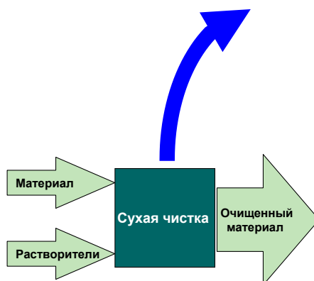
Рисунок 2-1 Схема технологического процесса для категории источника 2.D.3.f Химическая (сухая) чистка

Предметы одежды сначала проходят очистку в емкости с растворителем, затем высушиваются при помощи горячего воздуха. Растворители восстанавливаются, а загрязнения и жир, полученные в результате чистки, удаляются как отходы технологического процесса.