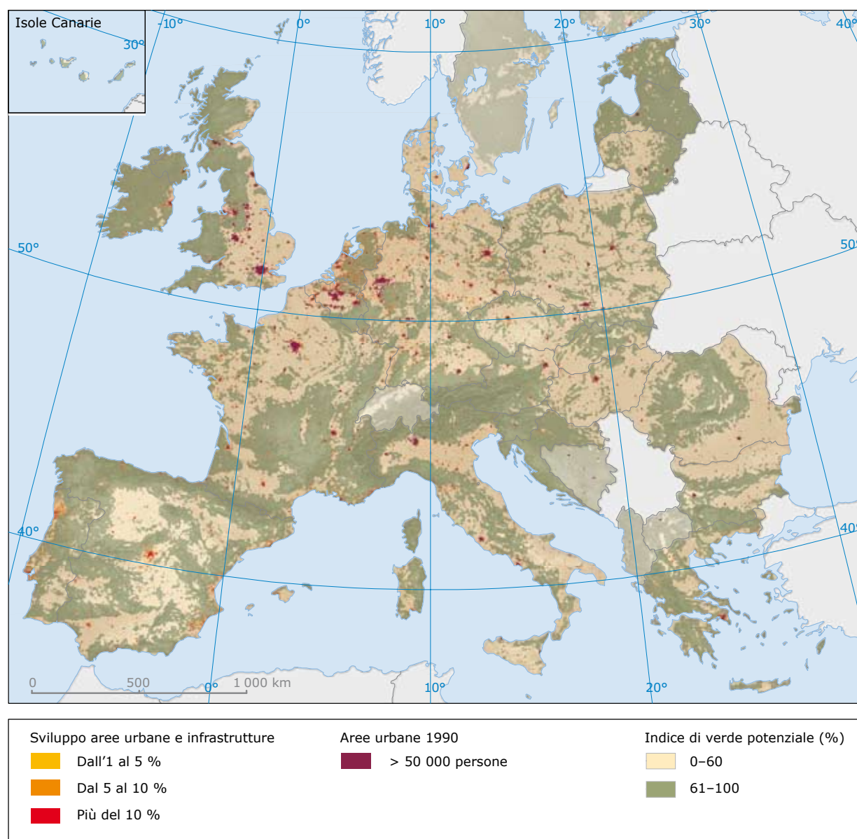
Figura 1 Espansione delle aree urbane e altre forme di trasformazione artificiale del suolo, 1990-2000

Fonte: Banca dati sulla copertura del suolo Corine, AEA.